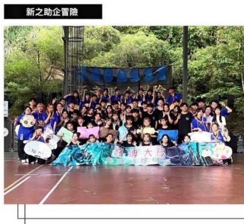
112 級企管系迎新宿營

企管系迎新宿營「新之助企冒險」於 9 月 16 至 17 日於新竹萊馥渡假村舉辦。由系學會同學們精心設計各式闖關活動與活力充沛的表演，水大遊戲與陸大遊戲，以及營火晚會等，兩天一夜的活動讓大家玩得不亦樂乎！