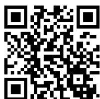
銘傳企管 粉絲專頁